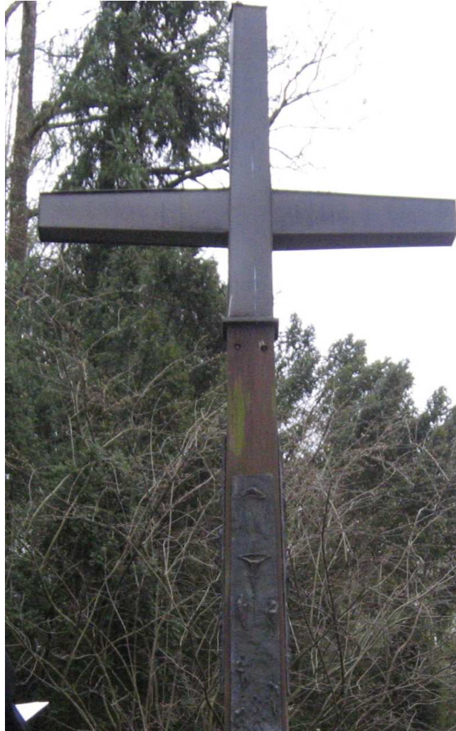
am KZ-Friedhof Leitenberg bei Dachau-Etzenhausen